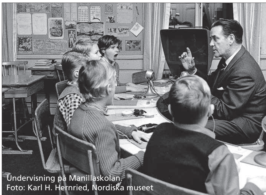
Undervisning på Manillaskolan.

att dagstidningar kan få statsbidrag för att ge ut taltidningar. Taltidningsutgivningen täcker landet, så att de flesta kan läsa åtminstone en lokaltidning. Alla tidningar som görs tillgängliga får statligt stöd för hela kostnaden. I dag kan synskadade få sin dagstidning på cd, via radioteknik, eller digitalt till mobiltelefonen. Än så länge är det kortversioner av tidningen som erbjuds men 2014 ska alla taltidningar finnas i digital form och innehålla hela tidningen.