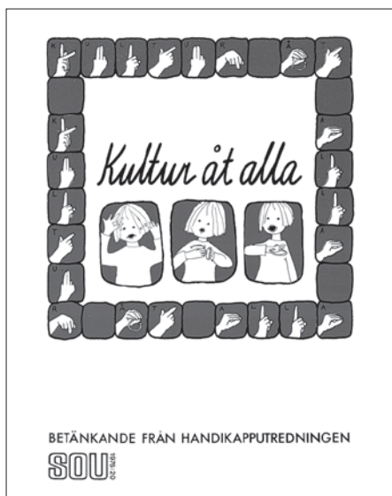
Kultur åt alla

som redan nämnts om utbildning för teckenspråkstolkar, tolkservice, texttelefon och att staten skulle ta över ansvaret för Tal- och punktskriftsbiblioteket fanns med bland förslagen.