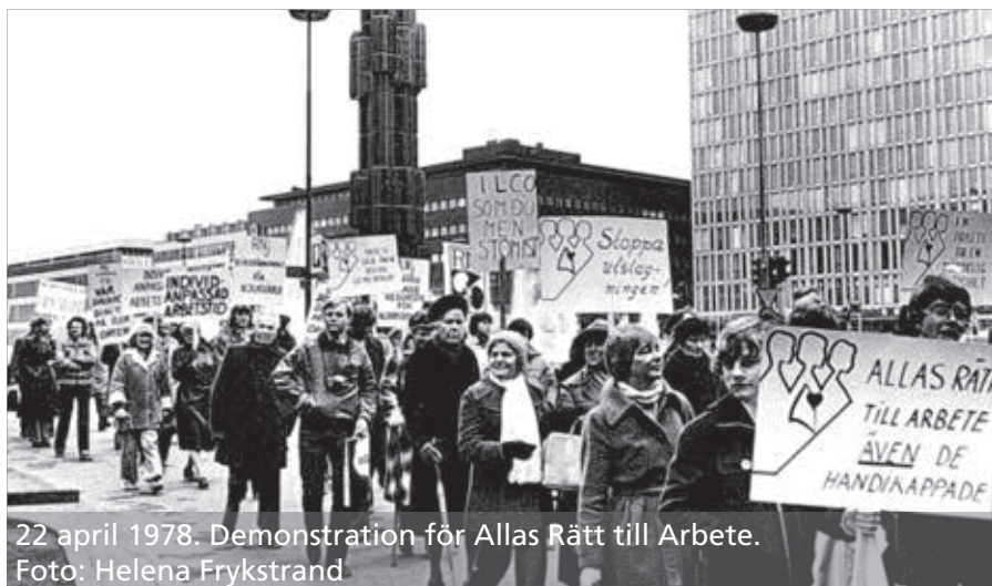
22 april 1978. Demonstration för Allas Rätt till Arbete.

1978 kom Sysselsättningsutredningens delbetänkande Arbete åt handikappade där man bland annat försökte blåsa liv i Främjandelagen. Även den här utredningen ansåg att samhället skulle ha rätt att påverka rekryteringen av arbetskraft och att arbetsgivarna skulle ta större ansvar för att alla fick en chans. Utredningen föreslog också anställningsformen lönebidrag och möjligheter att pröva ett arbete även om man har förtidspension.